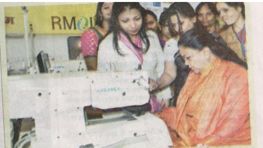
प्रदर्शनी के दौरान सिलाई मशीन पर काज बनाती मुख्यमंत्री वसुंधरा राजे।

राजे की एक झलक पाने को बेताब समारोह के दौरान मुख्यमंत्री और अन्य बड़े नेताओं के मंच पर पहुंचने के बाद कार्यकर्ता उनकी एक झलक पाने के लिए बेताब दिखे। इनमें महिलाएं और बच्चे भी शामिल थे। राजे के देखने के लिए सभा स्थल महिलाएं कार्यकर्ता खड़ी हो गईं। इससे पाडॉल में हल्की धक्का-मुक्की भी हुई, लेकिन वहां मौजूद महिला पुलिसकर्मियों ने समझावश कर उन्हें नीचे बेठाया। जत्थों के रूप में पहुंचे लोग बाहरी जिलों से आने वाले लोग कार्यक्रम स्थल पर जत्थों के रूप में नारेबाजी करते हुए पहुंचे। इस दौरान कार्यकर्ता भाजपा की झंडियां और बैनर लेकर आए, लेकिन पुलिस अधिकारियों ने झंडी बैनर अंदर ले जाने की इजाजत नहीं दी। इसके चलते उन्हें बाहर ही रखवा दिया गया।