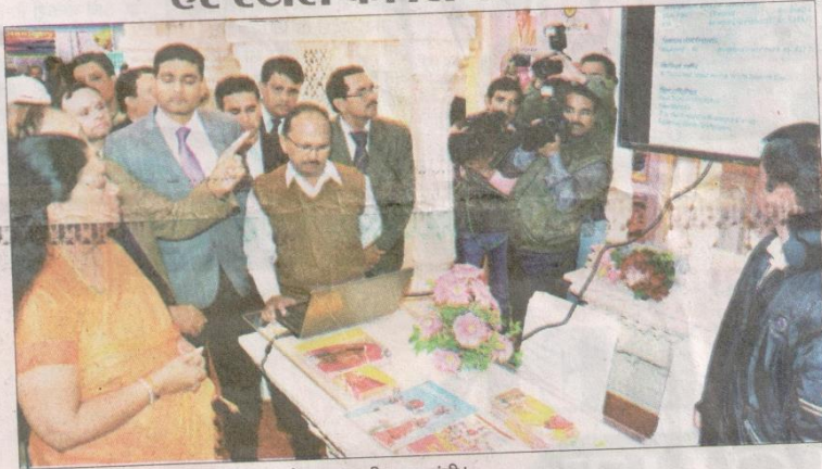
रामलीला मैदान में प्रदर्शनी का अवलोकन करती मुख्यमंत्री।